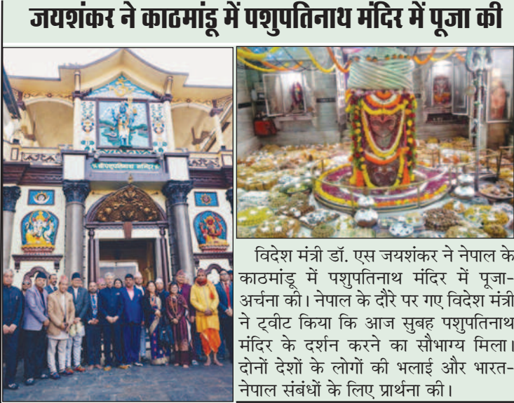
जयशंकर ने काठमांडू में पशुपतिनाथ मंदिर में पूजा की

प्रभावित जिलों में बुनियादी ढांचे के पुनर्निर्माण के लिए 1,000 करोड़ नेपाली रुपये यानी 7.5 करोड़ डॉलर देंगे।'